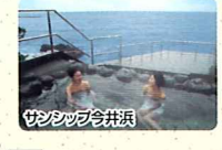
サンシップ今井浜 SunShip Imaiama Spa Center Sunship今井浜 썬십 이미야마

日帰り温泉 伊豆見高入谷高原温泉 Izumidakairiyakougen Spa