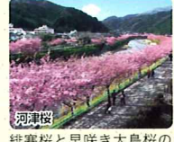
河津桜 緋寒桜と早咲き大島桜の自然交配種。ひと足早い、春の香りをお楽しみいただけます。