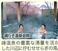
踊り子温泉会館 峰温泉の豊富な湯量を活かした川辺に佇むせせらぎの湯。

川端康成の『伊豆の踊り子』の舞台にもなった河津は、当時の光景をイメージしてくれる自然や見どころが数多く残されています。自然や、情緒溢れるハイキングコース。そして歩き疲れた体は、たっぷりの湯で癒してくれます。少し足を延ばせば、見所・湯所・花所にあふれる河津温泉郷をゆったりの人びりお楽しみ下さい。