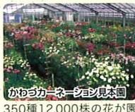
かわづカーネーション見本園 350種12,000株の花が園内一面に咲き誇ります。