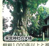
来宮神社の大楠 樹齢1,000年以上と推定される大楠(国指定天然記念物)。最大周囲14m、高さ24m。