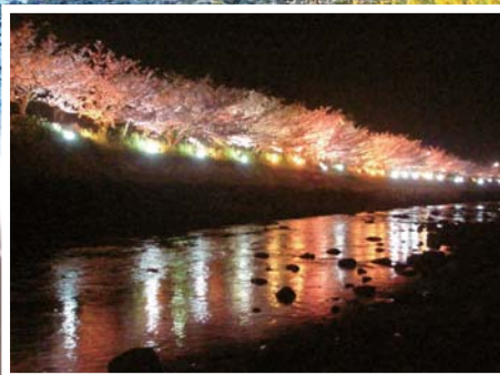
2. 河津樱夜间灯光景观 (赏樱会期间, 每晚 18点至 21点开放)