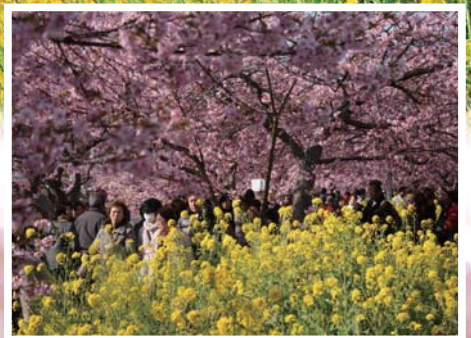
3. 河津岸边赏樱大道